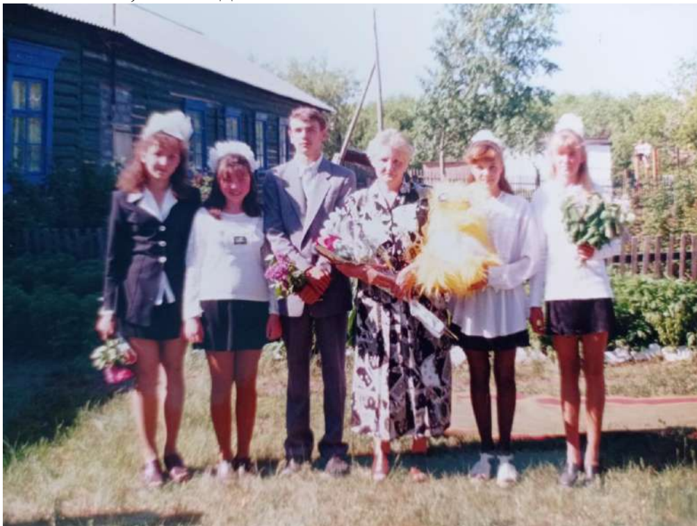
(выпуск 2000-2001 год)