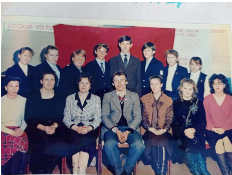
(1989-1990 г. педагогический коллектив Верхнеильинской школы)

В 1982 году ушла с должности директора и вновь стала учителем математики.