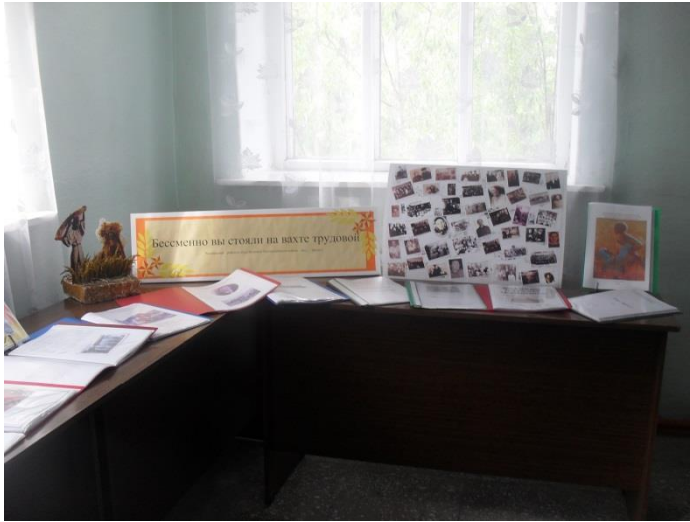
Выставка к конкурсу: «Бесменно вы стояли на вахте трудовой»