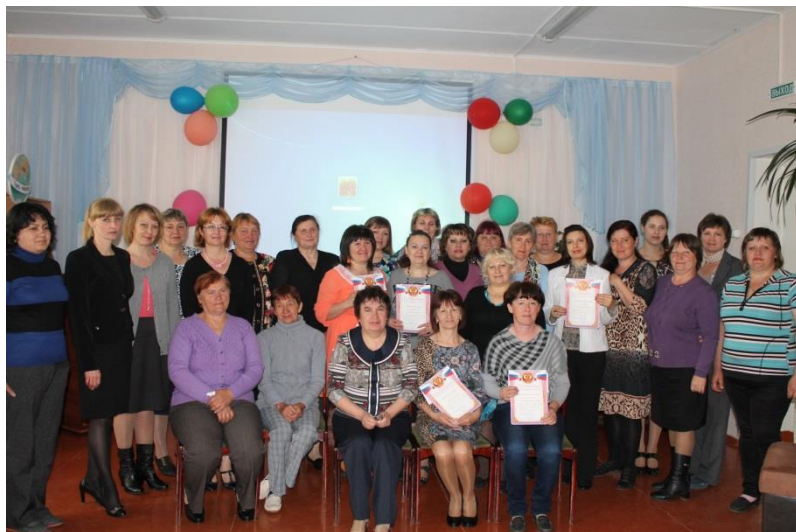
участники и победители конкурса