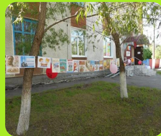
Центральная детская библиотека ул. Пролетарская