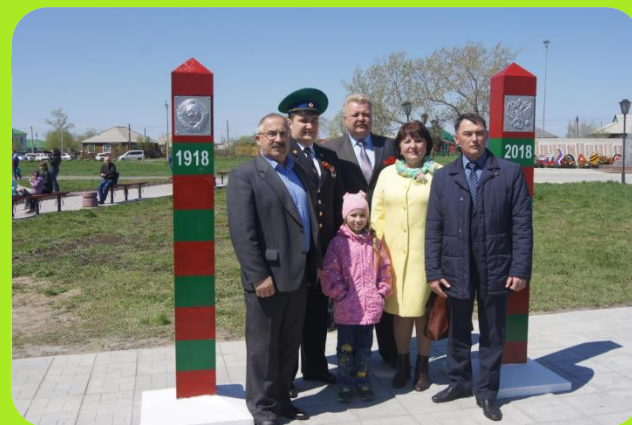
Памятный знак – Пограничный столб