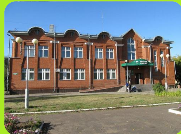
Сбербанк ул. Ленина