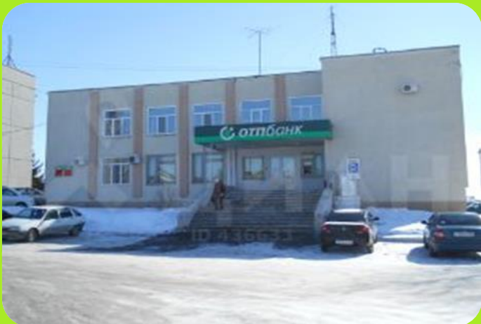
ОТПбанк ул. Победы