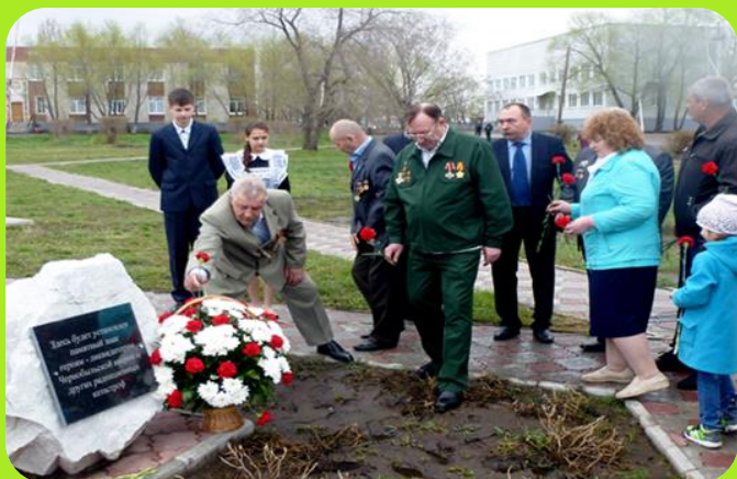
Камень памяти чернобыльцам