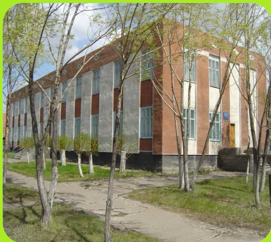
Районная библиотека ул.