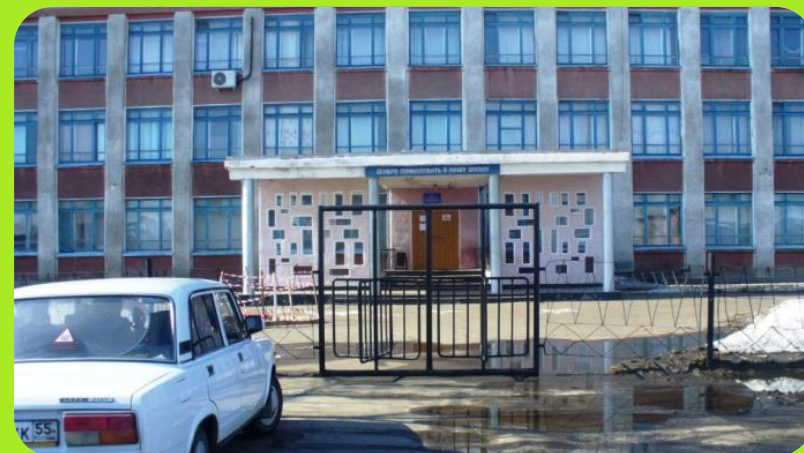
Школа № 2 ул. Красноармейская