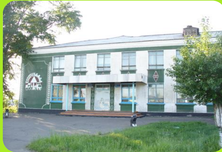
Сибирский профессиональный колледж ул.4 Восточная