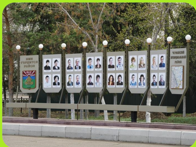
Доска Почета «Ими гордится район» ул.Победы