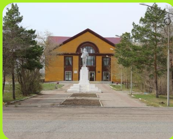
Дом культуры ул. А-Буя