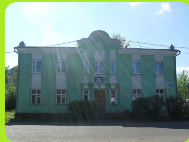
Музыкальная школа ул. Победы