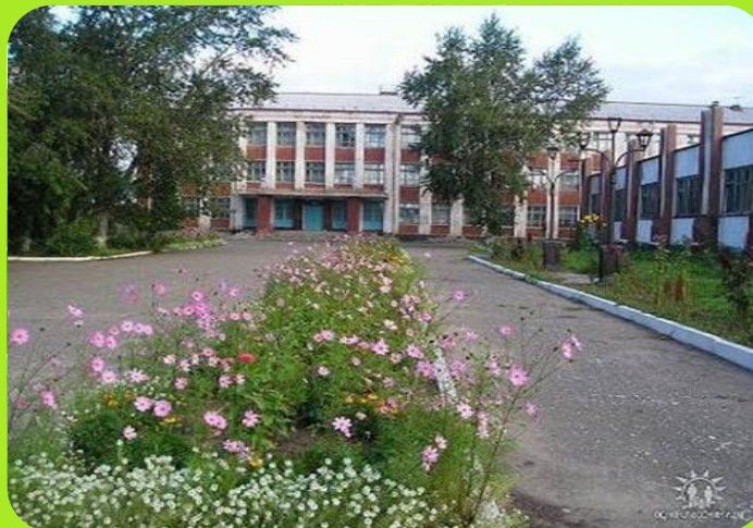
Школа №1 ул. Зеленая