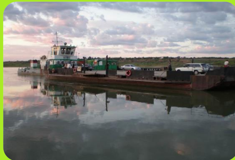
р. Иртыш . Переправа