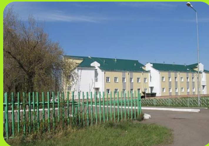
Центральная районная больница ул. Транспортная