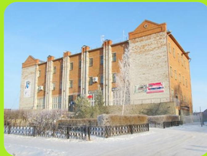
Почта России ул. Мельникова