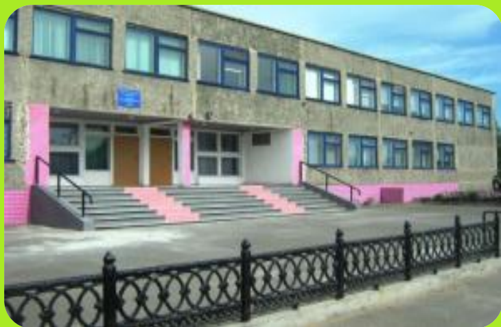
Гимназия ул. Лесная