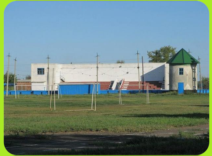
Стадион ул.50 лет Октября