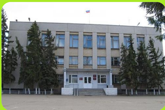
Здание районной администрации ул. Победы