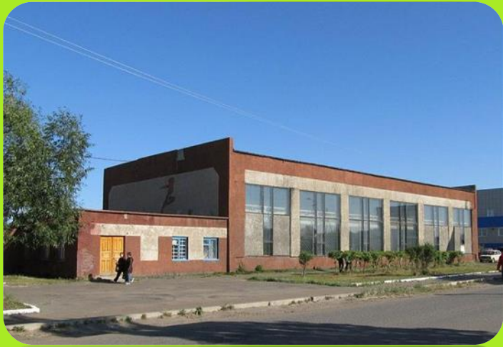
Спортивная школа ул. Зеленая