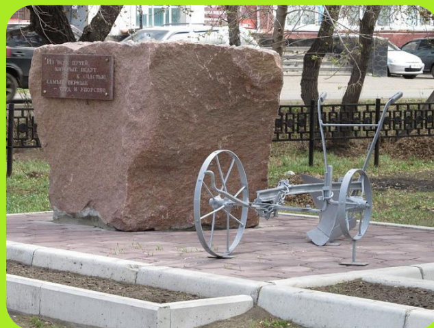
Памятный камень в честь Почётных жителей Черлакского района на улице Победы.