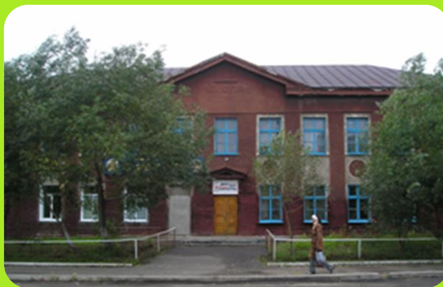
Дом творчества ул. Победы