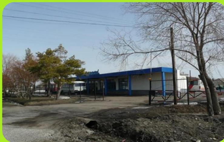
Вокзал ул. 2 Восточная