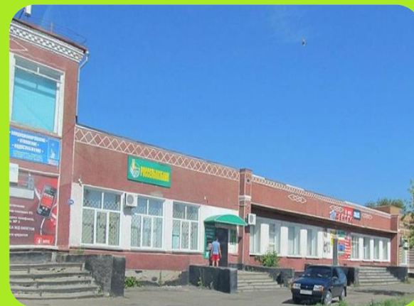
Россельхозбанк ул. Мельникова