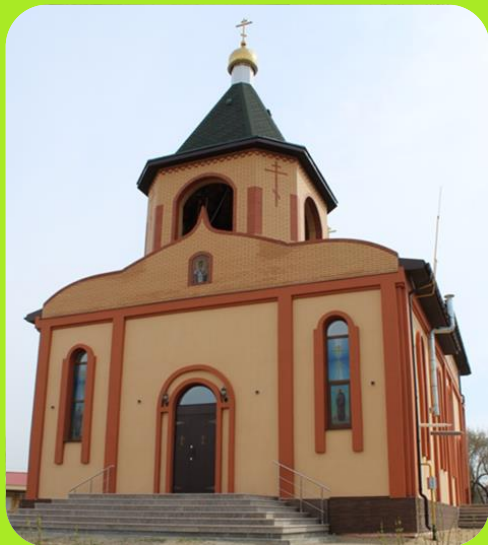
Святоникольская церковь на пересечении ул. Почтовой и Ленина