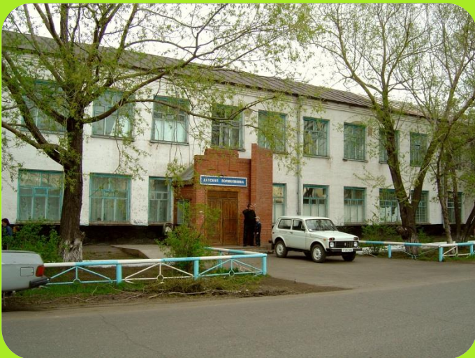
Детская поликлиника ул. Транспортная