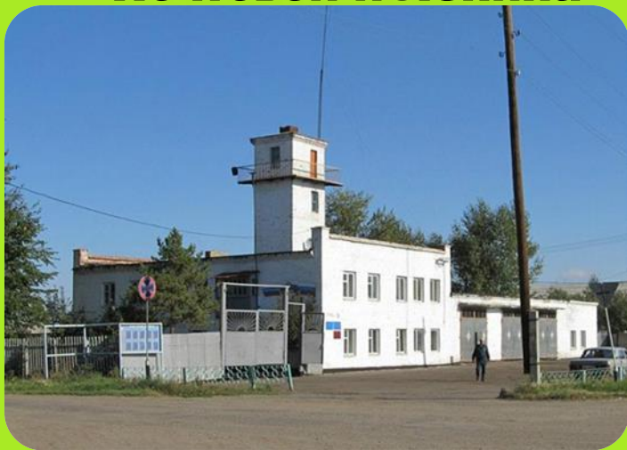
Пожарная часть ул. Почтовая