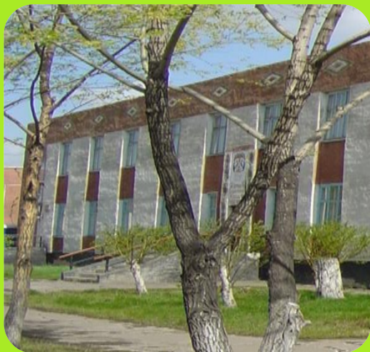
Школа искусств ул. Пролетарская